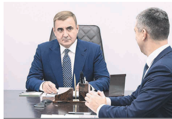
Алексей Дюмин Губернатор Тульской области.

Г убернатор Алексей Дюмин провел встречу с министром по информатизации, связи и вопросам открытого управления Тульской области Ярославом Раковым.