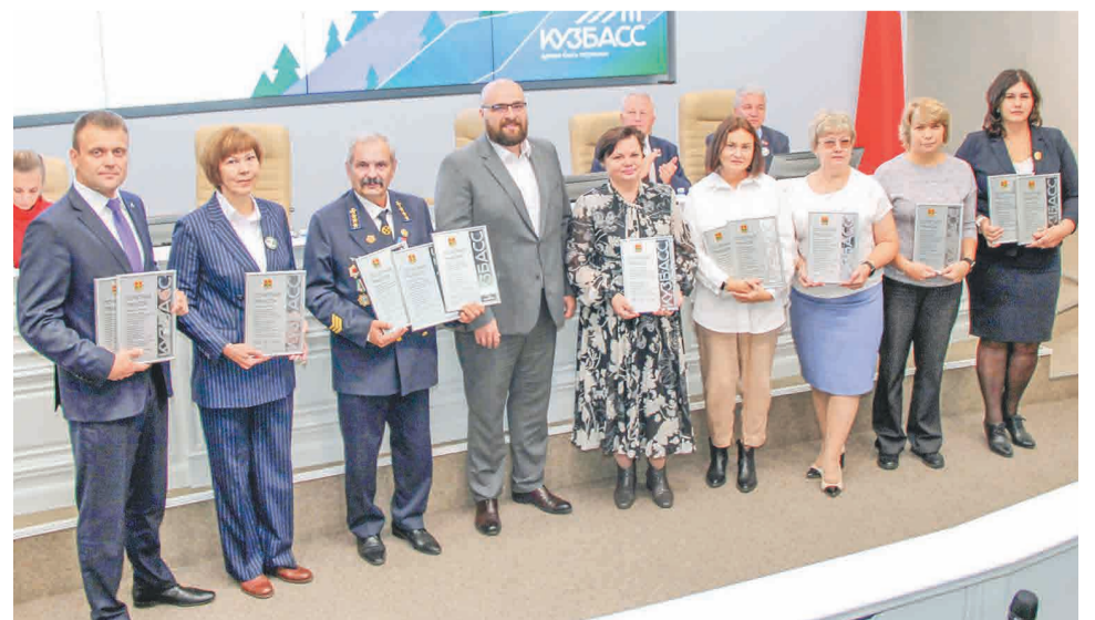
↑ ПАО «Кокс» представит Кузбасс на всероссийском этапе конкурса.

Теперь ПАО «Кокс», вошедшее в число лидеров, представит Кузбасс на всероссийском этапе конкурса. Завод принимает участие в состязании организаций с высокой социальной эффективностью с 2015 года, ежегодно занимает в нем призовые места.