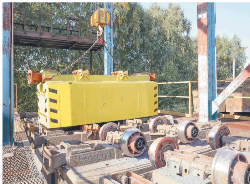
↑ Монтаж нового корпуса вагонетки ВГ-4,5.