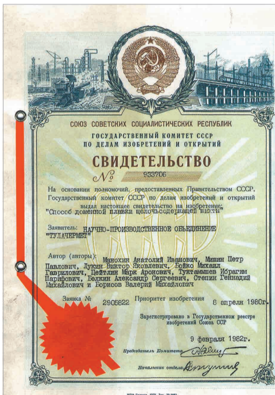
Патентное удостоверение. 1980 год