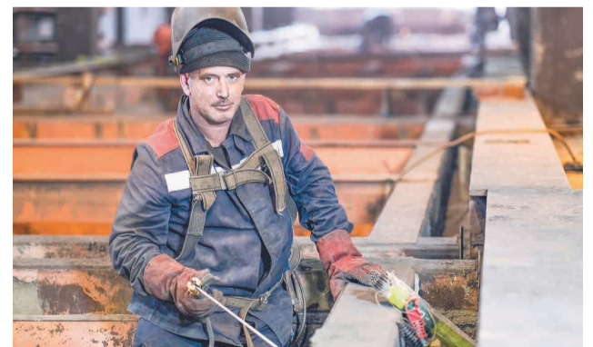
↑ Монтаж каркаса агломашины.

Заменен старый эксгаузер, проводится его подключение к скрубберам. На 95% смонтирован бункер шихты с дозатором.