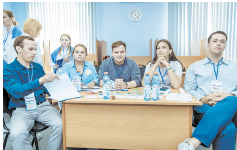
Уже совсем скоро участники конкурса узнают, кто стал лучшим.