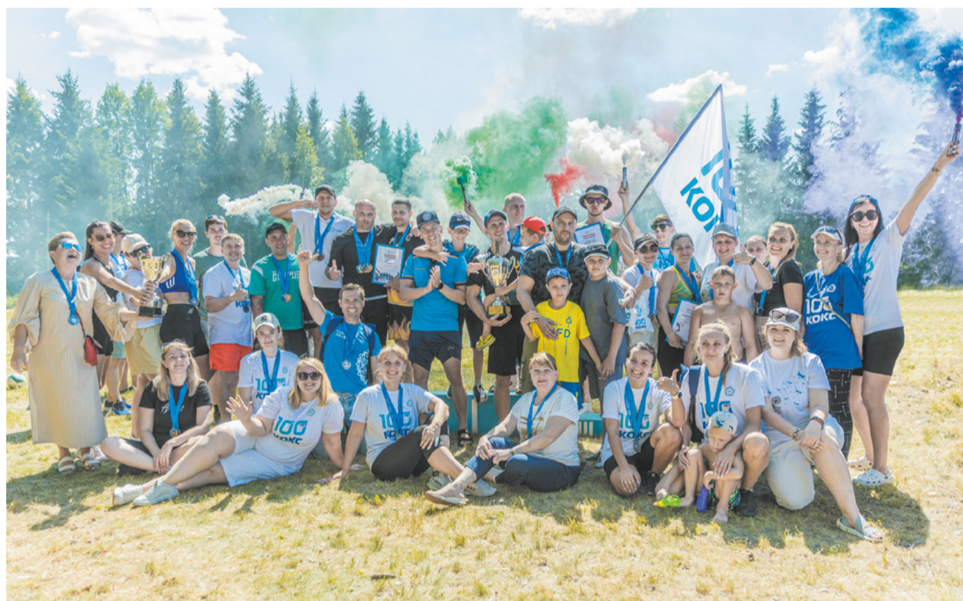
На турбазе ПАО «Кокс» традиционно прошёл весёлый спортивный и семейный праздник. Подробнее на стр. 6-7.