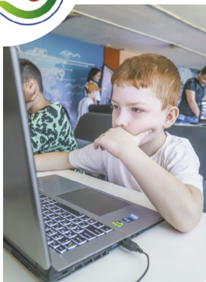
Знакомство с производством в детстве – путь к верному выбору профессии.