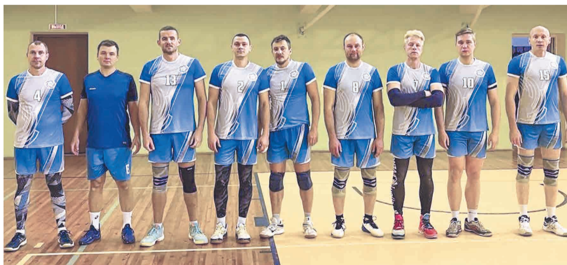
→ Команда «ПромСорт- Тула».

Сезон 2023/24 начался в октябре. На сегодняшний день сыграно 2 матча. По регламенту все 22 команды-участницы разделены на две лиги — первую и высшую. Сталевары заявлены за высшую, где им предстоит помериться силами с восьмью соперниками.