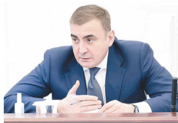
Алексей Дюмин Губернатор Тульской области.

Н а еженедельном оперативном совещании под председательством Губернатора Алексея Дюмина обсудили благоустройство в регионе.