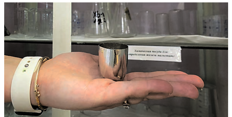
Платиновому тиглю нипочем 1150 градусов жары

На каждом участке лаборатории есть сейфы для хранения дорогой посуды. Каждые полгода контролируют изменение веса платиновых тиглей. При критических показателях их сдают и приобретают новые.