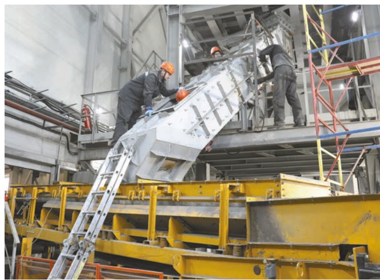
На участке №3 ДОФ идет монтаж новой футеровки

В корпусе средне-мелкого дробления завершается монтаж полимерно-керамической футеровки. Износостойкий и ударопрочный материал защитит оборудование и минимизирует его простои.