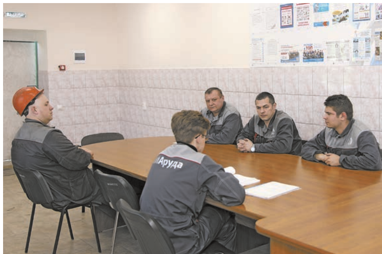
Комната энергетиков на участке №1 ДОФ