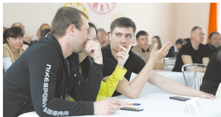
Команда желдорцева в поисках верного ответа