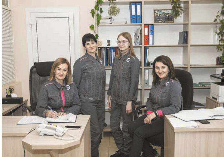
Новая табельная на шахте