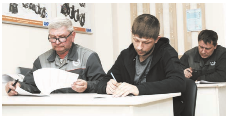
Первый этап конкурса – 50 тестовых заданий за полчаса