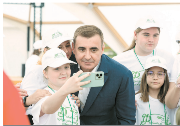
Алексей Дюмин Губернатор Тульской области.

В рамках визита в Тульскую область Заместителя Председателя Правительства РФ Татьяны Голиковой на базе отдыха «Шахтер» состоялось торжественное открытие молодежного фестиваля изобразительного искусства «Поленово — Бунырево».