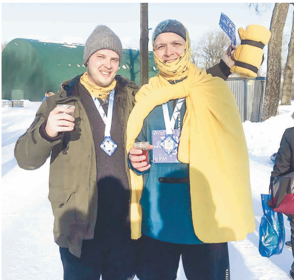
↑ Никто не замерз — согреться помог горячий чай с зефиром и походная гречневая каша на финише.