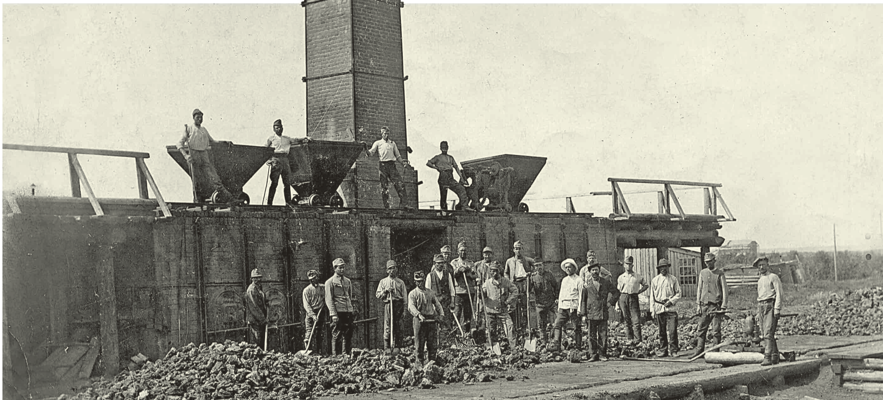
← Строительство пробной печи коксохимического завода.