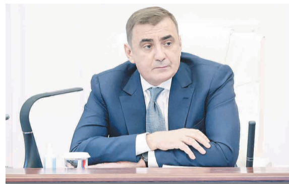
Алексей Дюмин Губернатор Тульской области.

Н а оперативном совещании под председательством Губернатора Алексея Дюмина обсудили план мероприятий Года семьи в Тульской области.