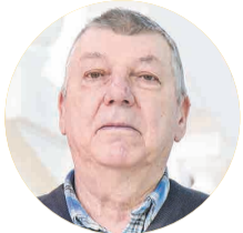
Эдуард Иосифович Садовский