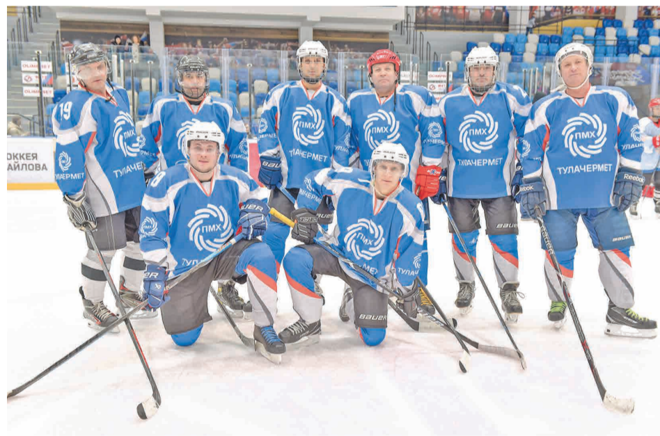
↑ Сборная Тулачермета и Промсорт-Тулы.