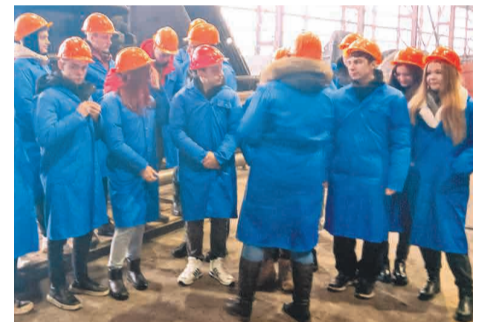
Студенты ТГМК им. Н. Демидова в ЦРМО.