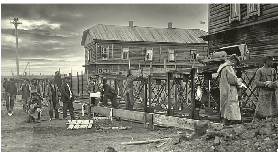
↑ Строительство жилых домов Нижней колонии. Коксохимзавод, г. Щегловск, 1924 г.

В преддверии векового юбилея рассказываем, как развивалось старейшее предприятие Кузбасса, чем жили коксохимики и какой вклад в развитие города они внесли