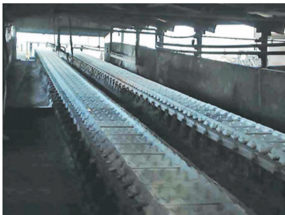
Участок разливки чугуна.

Так, еще в канун 1993 года был пущен в эксплуатацию цех шлакопереработки и шлакоблочных изделий. В декабре 1994-го введена в эксплуатацию малогабаритная установка придоменной грануляции шлака. На первой доменной печи после ремонта была введена в эксплуатацию установка, аналогичная той, что уже была установлена на ДП-3 – предварительного смешивания природного газа с кислородом и подачи этой смеси через фурмы в доменную печь. Эта операция увеличивала эффективность использования природного газа в доменной плавке за счет увеличения полноты его сгорания в окислительной зоне печи и повышала коэффициент замены кокса природным газом на 7-10 процентов. Эта эффективная разработка родилась в НПО «Тулачермет» и была уже внедрена не только в Туле, но и на Магнитогорском, Нижнетагильском и Череповецком металлургических комбинатах.