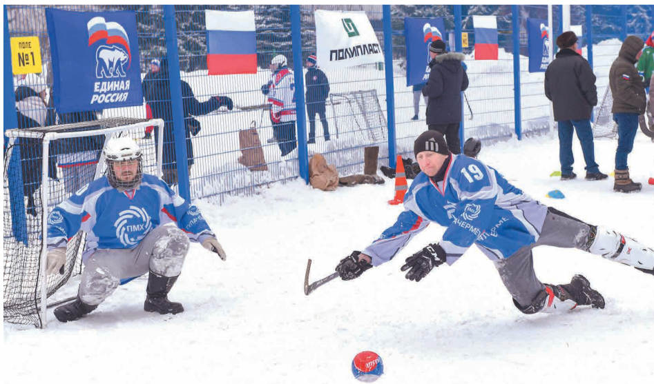
↑ Металлурги защищают свои ворота.