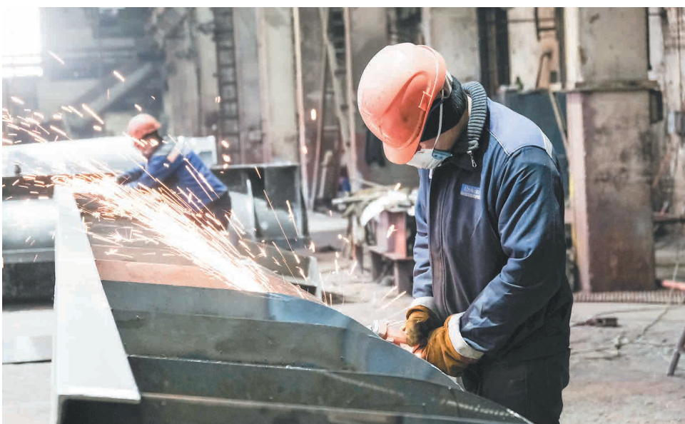
↑ Приоритетной задачей остается исполнение внутригрупповых заказов — на Тулачермет и КМАруду.

1600 тонн металлоконструкций — таков общий объем заказов, выполняемых АО «ЦЗ «КВОИТ» по новым сторонним объектам.