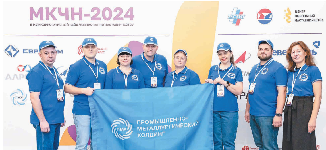
← Победители внутреннего соревнования представили холдинг в Москве.

В рамках деловой программы эксперты ПМХ приняли участие в обсуждении квалификационных характеристик для наставников в сфере труда и организаторов системы наставничества,