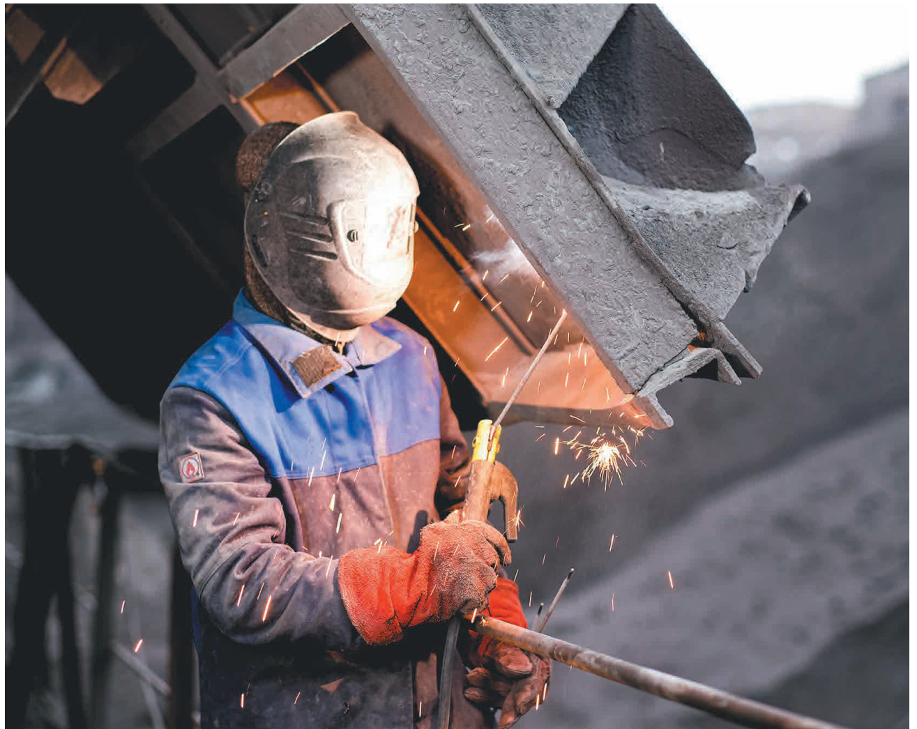
↑ Монтаж козырька питателя.