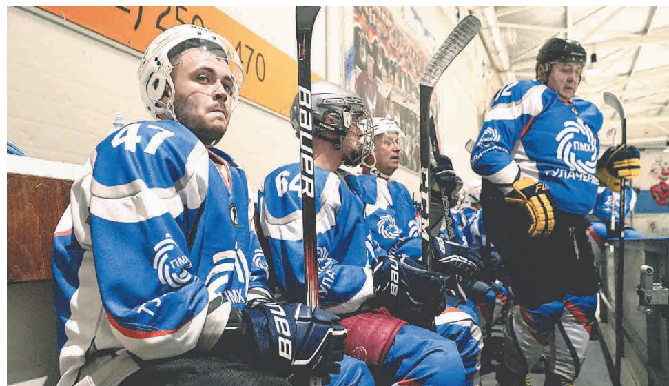
↑ Сейчас в команде 23 хоккеиста.

Помимо ярких впечатлений от выступлений в НХЛ наши хоккеисты в новом сезоне обзавелись и новой традицией. После каждого выигранного матча команда выбирает лучшего игрока. Вместе с этим почетным званием хоккеист получает право на ношение и хранение специального символа — войлочной шляпы горного. Это своего рода амулет команды, который игрок должен хранить вплоть до следующей победной игры. А вот останется символ победы у него или достанется уже другому, будет зависеть от самого игрока.