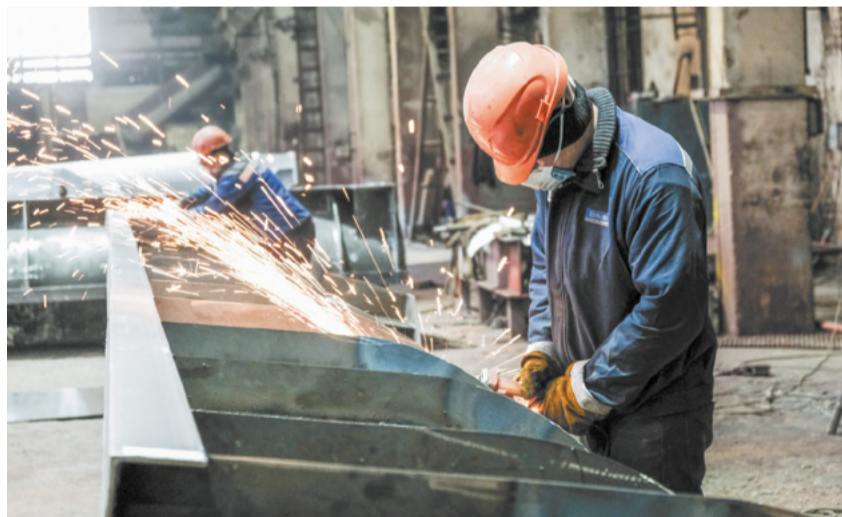
Продукция КВОиТ востребована внутри группы и у сторонних предприятий.

– Для этого заказа от производственных и технологических служб потребовалась разработка и отладка системы нанесения лакокрасочного покрытия. Здесь накладывается слой дорогостоящего грунта, а также непростая в нанесении эмаль. Общая толщина покрытия