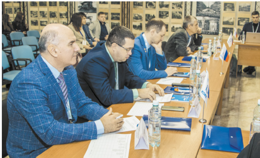
Научные работы участников конференции оценили эксперты.