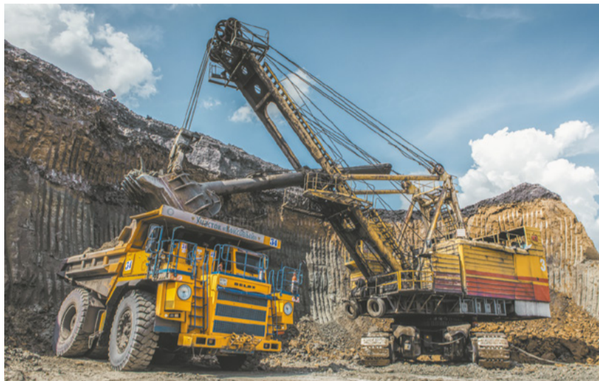
Угледобывающее предприятие вышло на новый этап развития.

Екатерина ЛЕВОНТЬЕВА levonteva_ep@metholding.com