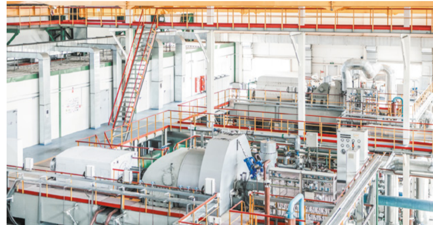
В ПАО «Кокс» идеи об улучшении технологических процессов КЭС подают многие работники.

Найти идею для проекта не так сложно: всегда есть какая-то интересная задача, которую надо бы решить, но никак не получается ею заняться. Если же дать стимул – сразу найдутся силы