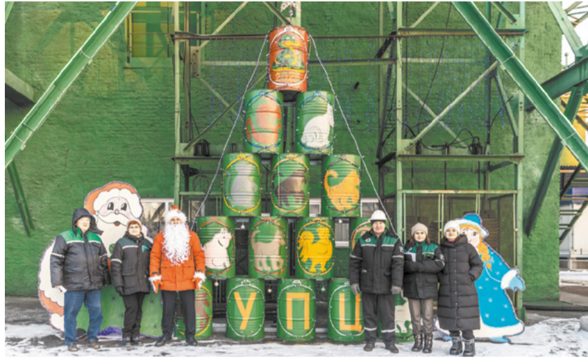
Все символы года есть в УПЦ, но сейчас торжествует змея.