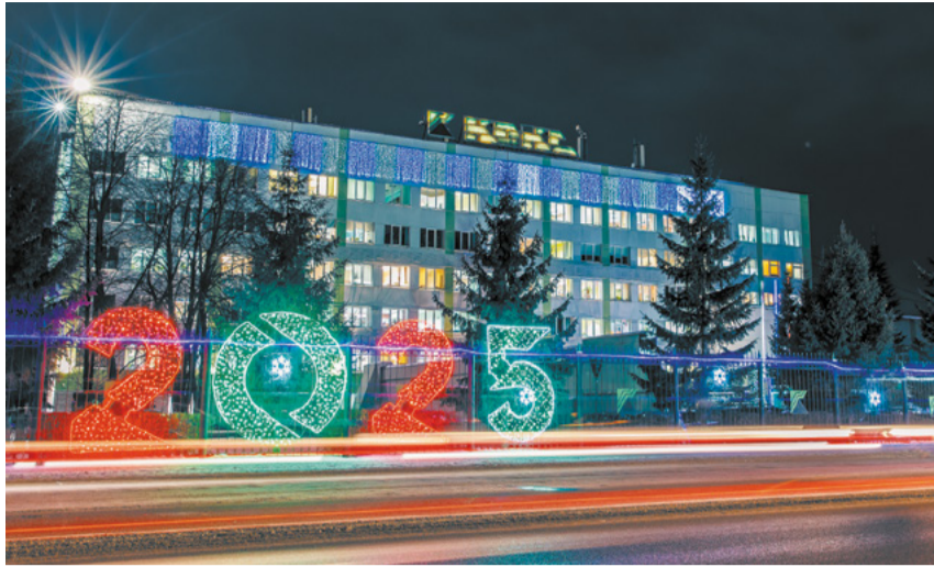
Засветилось огнями здание заводоуправления.