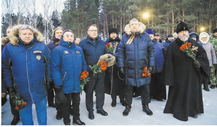
В Прокопьевске состоялось открытие стелы.