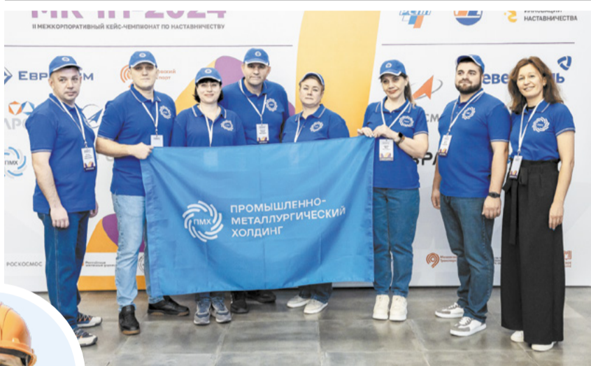
Команда ПМХ и Промсорт показала мастерство на чемпионате.

Екатерина ЛЕВОНТЬЕВА, Сергей УСТИНОВ levonteva_ep@metholding.com