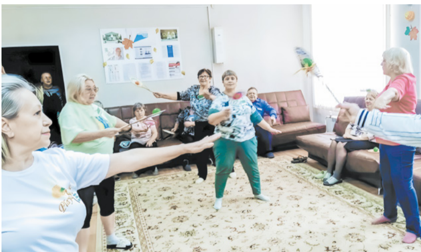
На оздоровительной смене побывали наши ветераны.