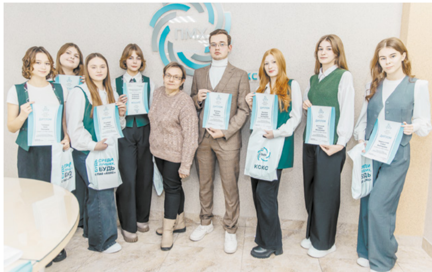
Свои научные проекты на НПК представили школьники Кемерово.