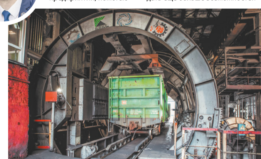
Одно из самых известных рацпредложений ПАО «Кокс» – модернизация вагоноопрокидывателя ВРС-125.

Я посещаю производственные площадки, беседую о возможных улучшениях на предприятии, помогаю