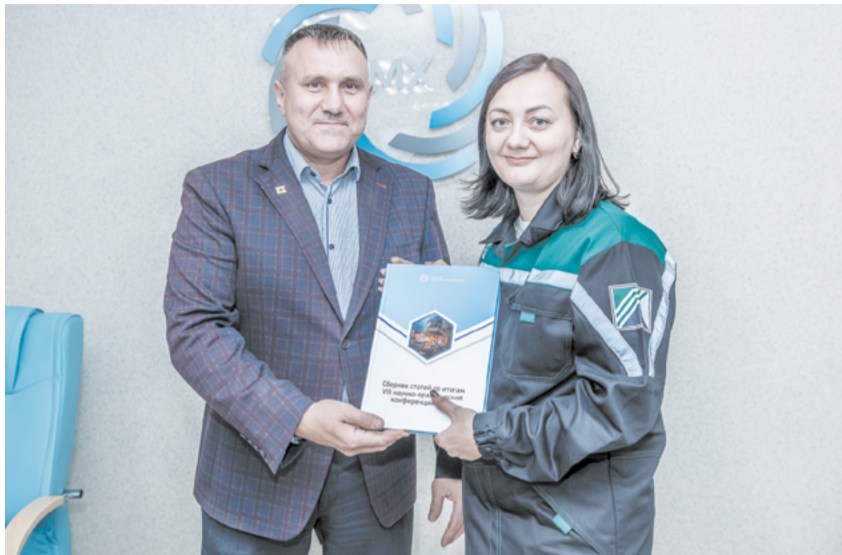
Участники НПК получили сборники научных статей.

Участникам VIII конференции в торжественной обстановке вручили сборники лучших статей сотрудников предприятий ПМХ. В них вошли