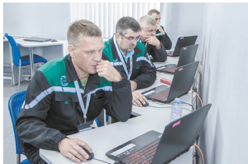
Профэкзамены будут проводиться по всем рабочим специальностям.

и технологических операций, а также действий в случае возникновения аварийных ситуаций. Первыми свои навыки демонстрировали машинист коксовых машин