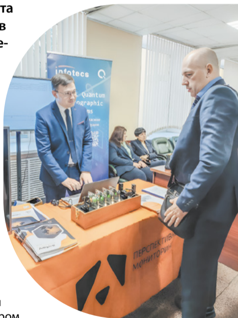
Выставка цифровых технологий.

На мероприятии вручены почётные грамоты Министерства цифрового развития, связи и массовых коммуникаций РФ, медали «За особый вклад в развитие Кузбасса», «За служение Кузбассу», «За бизнес во имя созидания», «За веру и добро».