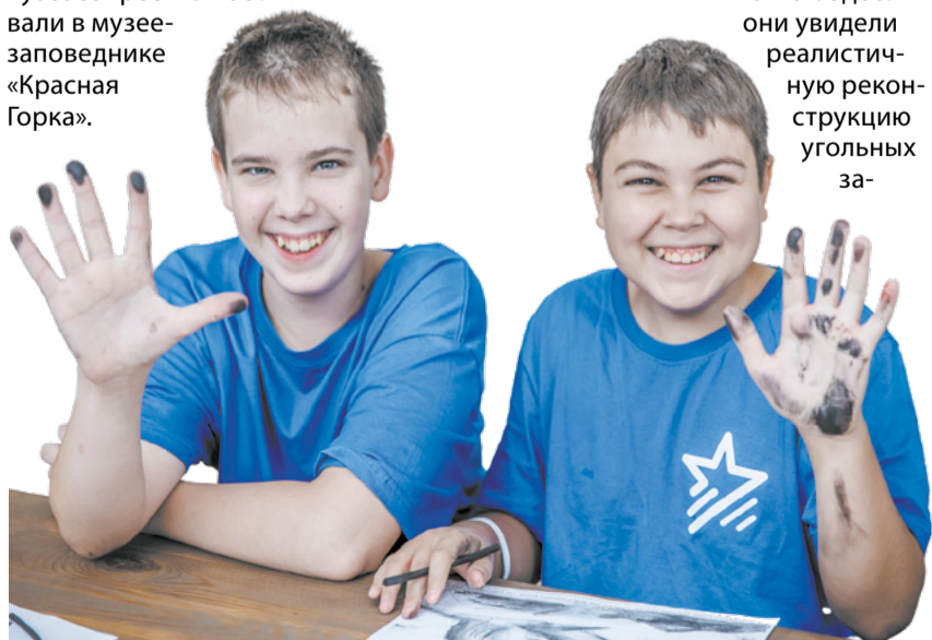
Весёлая и полезная смена ждала ребят в «Сириусе».

– Мне 14 лет, и я впервые сюда попала. Когда мама, которая работает в отделе развития и обучения персонала, предложила попробовать пройти отбор в «Сириус. Кузбасс», я с радостью согласилась. Условия очень классные, мы жили по двое в комнате. Кормили нас хорошо, по пять раз в день – здесь вкусные борщи и котлеты. Понравилось занятия и мероприятия от вожатых. Больше всего заинтересовала психология.