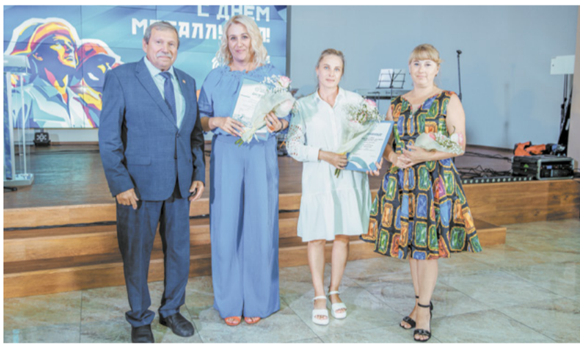
Лучший проект среди заводских коллективов – у коксового цеха.

Анастасия СЕМЫКИНА semykina_ae@metholding.com