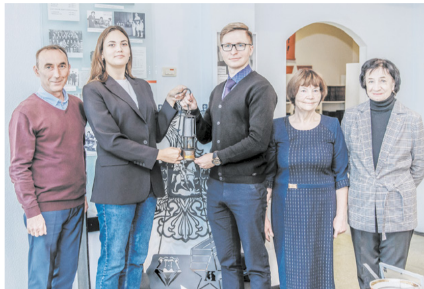
Эстафету поколений передали представителям мехзавода.

чании церемонии передачи шахтёрской лампы сотрудникам ПАО «Кокс» рассказали об истории создания и функциях комсомольской ячейки на механическом заводе, а