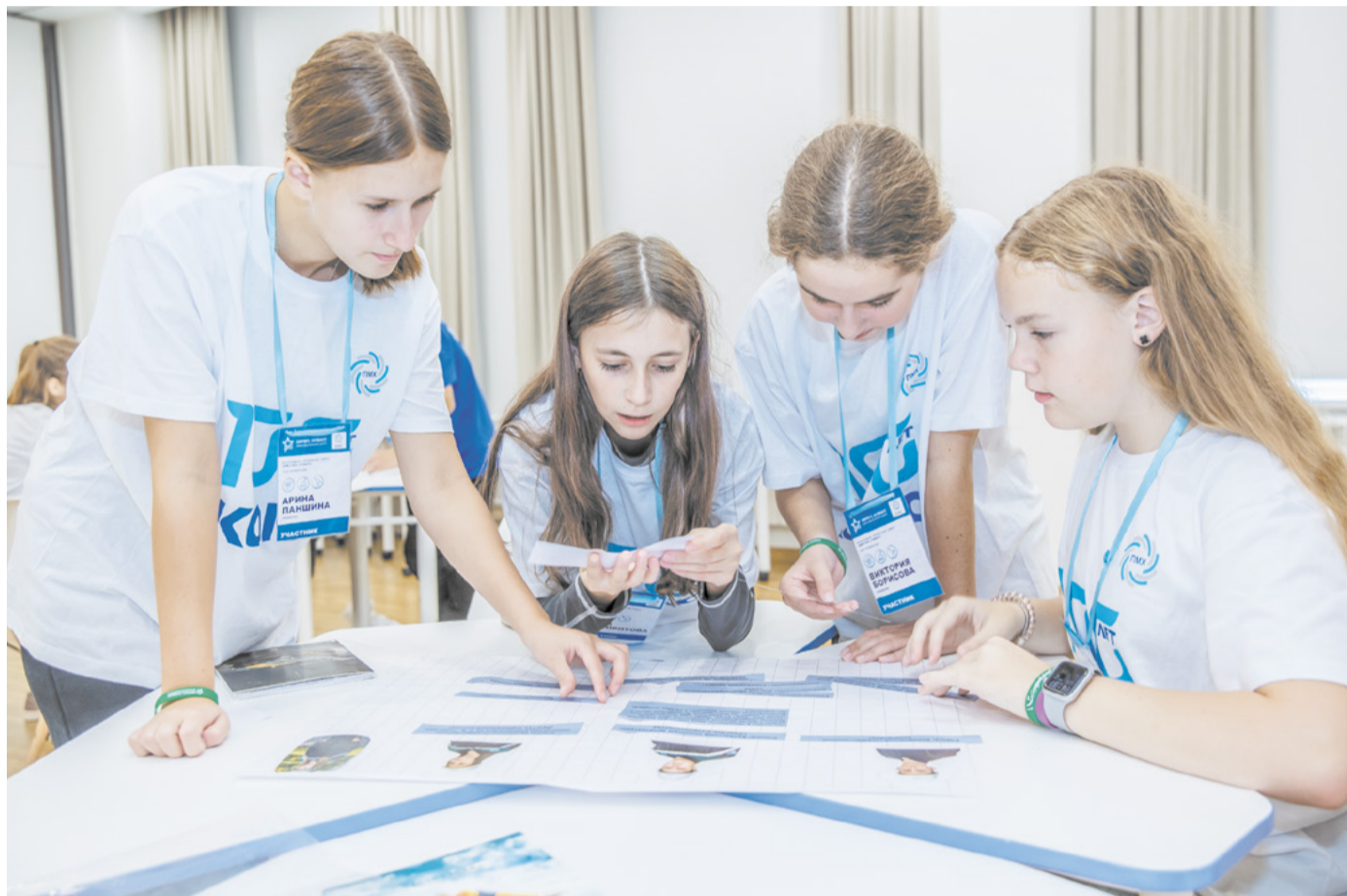
Ребята провели увлекательные десять дней в образовательном центре «Сириус. Кузбасс».