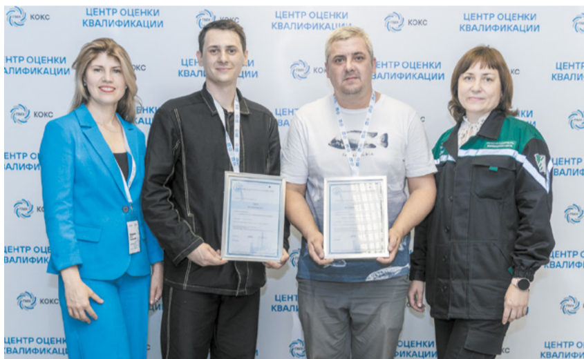
Первые профессиональные экзамены прошли успешно.

при этом своё профессиональное мнение, – подчёркивает исполнительный директор ООО УК «ПМХ»