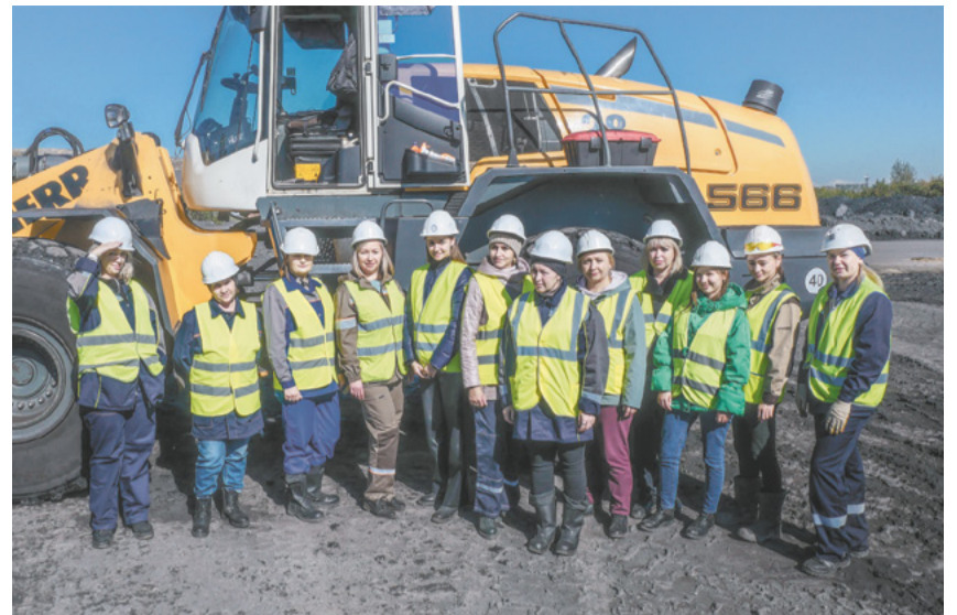
Новые работники участка побывали на производственной площадке.