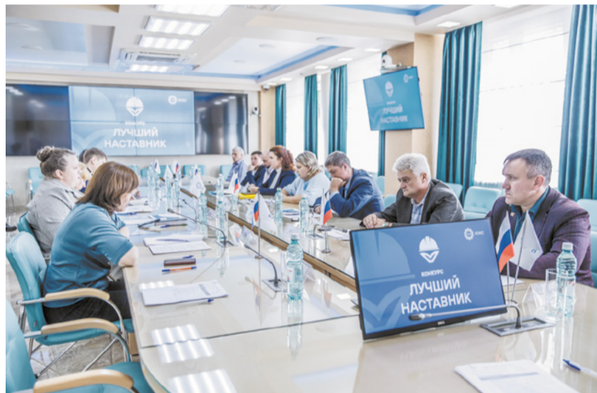
Первый этап конкурса прошёл на предприятиях Кузбасса.

– Сейчас многие предприятия испытывают нехватку квалифицированных кадров. В этом плане наставничество играет большую