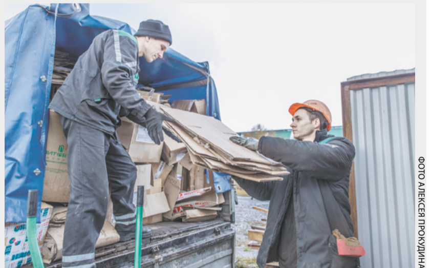
Молодые специалисты приняли участие во Всероссийской акции «БумБатл» национального проекта «Экология» по сбору макулатуры. В сентябре от ПАО «Кокс» на переработку отправится 400 кг бумаги и картона.