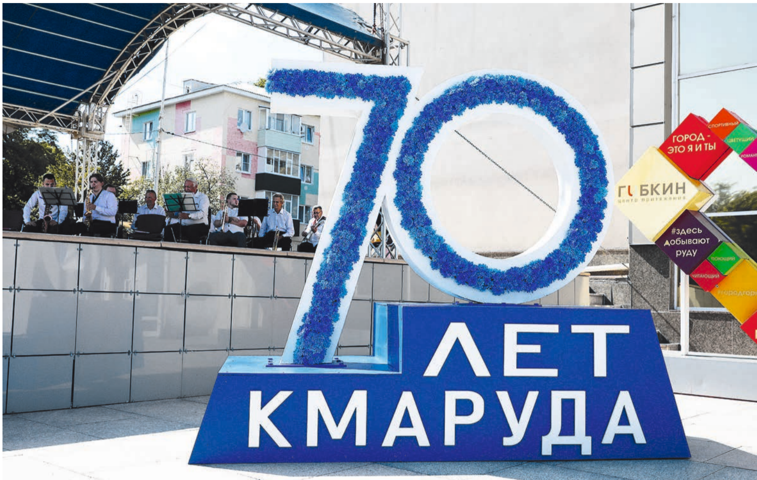
У входа в ЦКР «Форум» гостей встречал праздничный оркестр и юбилейная стена.

на Доску почета комбината: – Оказаться на сцене в День шахтера – большая честь. Праздник стал общим для всего комбината недавно, но правильно: каждый чувствует причастность к общему делу.