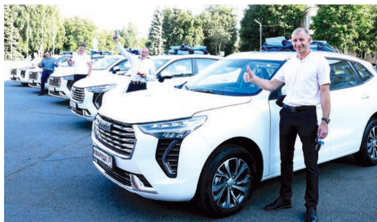
Парад подарочных машин и их счастливых обладателей.