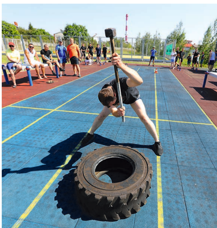
Молот в сильных шахтерских руках.

Тактика сработала. Превосходство над соперниками в двух этапах составило чуть более четверти минуты, но этого оказалось достаточно. Поздравляем чемпионов и благодарим спортсменов за эмоциональное субботнее утро!