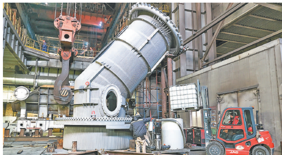
↑ Специалисты Промсорт-Тулы готовят оборудование к установке.

В настоящее время специалистами «Промсорт-Тула» проводится подготовка кессона к установке. Уже состоялась промывка кессона. Рабочие подключили к входному и выходному коллекторам оборудования, создав тем самым замкнутый контур циркуляции, подавая специально подготовленный водный-химический состав для очистки внутренних поверхностей труб от различных отложений и нанесения специального защитного слоя, который позволит увеличить срок службы кессона. На следующем эта-