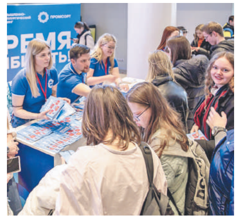
Студенты задавали много вопросов представителям Тулачермета.

Специалисты предприятия и холдинга, а также партнерской компании «Промсорт», приняли участие в ярмарке вакансий, которая прошла в Московском институте стали и сплавов. Здесь они смогли рассказать о работе наших предприятий и ответить на вопросы студентов, которые совсем скоро станут высококвалифицированными металлургами.