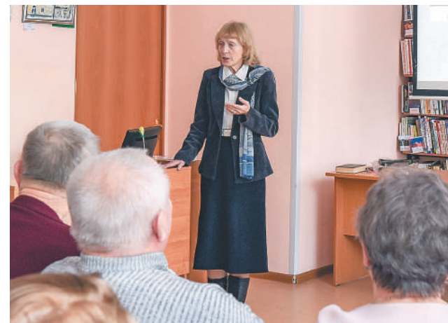
↑ Лекция из цикла «Угостите историей».

Кстати, у Пушкина с Гончаровой было четверо детей. И с потомками знаменитых родителей также