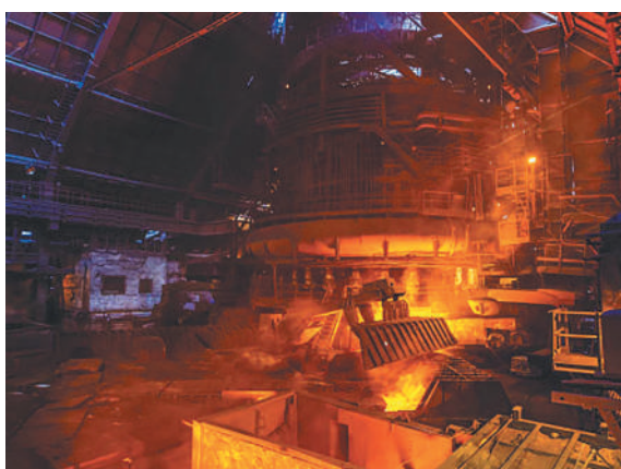
Литейный двор доменной печи № 3.

Впервые за всю историю предприятия практически была решена проблема его энергетической безопасности — 97 процентов потребляемой электроэнергии выработано на заводской ТЭЦ.