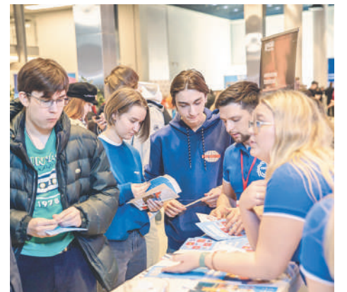
Специалисты рассказали студентам о преимуществах работы в ПМХ.

Все о практике и стажировках, карьерных перспективах для начинающих специалистов и многом другом, что предусмотрено для будущих сотрудников Тулачермета и других предприятий ПМХ, смогли узнать студенты университета МИСиС.