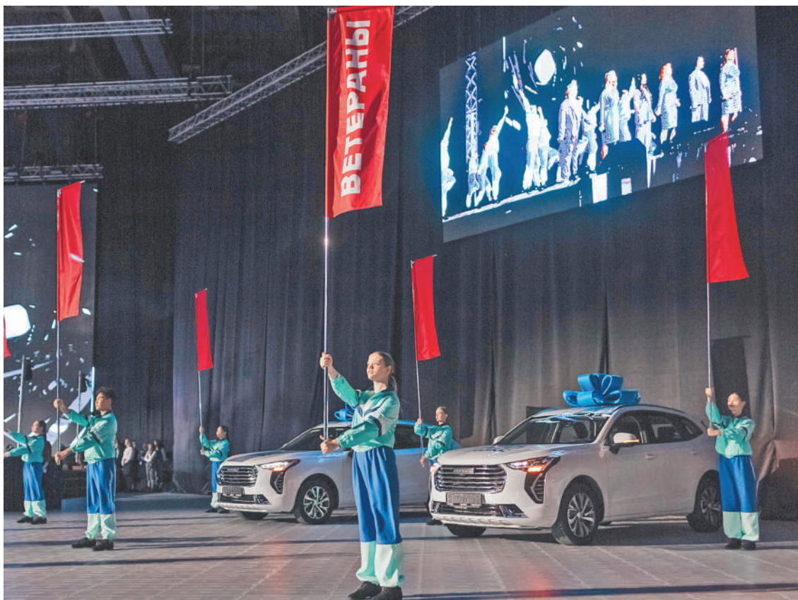
↑ Десять работников получили ключи от автомобилей HAVAL.