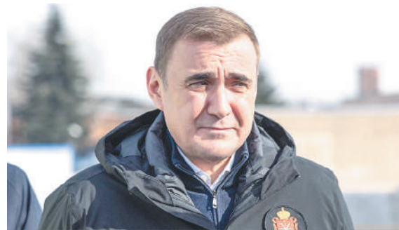
Алексей Дюмин Губернатор Тульской области.

Г убернатор Алексей Дюмин посетил строительство моста через р. Упу в Туле. Это крупнейший инфраструктурный проект для Тульской области. Глава региона осмотрел возведенные пролеты моста и эстакады и ознакомился с ходом работ. — Это масштабный и долгожданный проект. Он позволит разгрузить основные транспортные артерии города, соединить Зареченский округ с Привокзальным и Советским, снизить количество заторов и повысить безопасность дорожного движения.