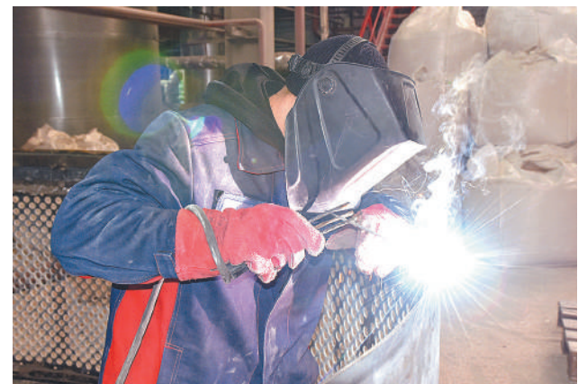
➔ Сварка сегмента обечайки.

В настоящее время представители подрядной организации «СпецКислородМонтаж» занимаются обратной сборкой обечайки. Из сегментов необходимо сварить цилиндр диаметром 3400 см и высотой 5000 см, затем обратно установить сегменты в сосуд. Также предстоит полностью заменить фильтровальную сетку, которая удер-