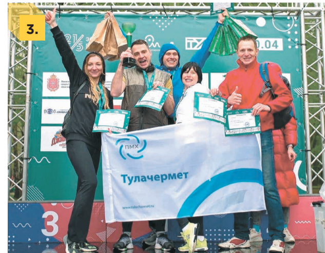
1. Участие в эстафете приняли более 800 спортсменов из 8 регионов России. 2. До первого места лучшим бегунам ПМХ не хватило совсем чуть-чуть. 3. Команда Тулачермета.