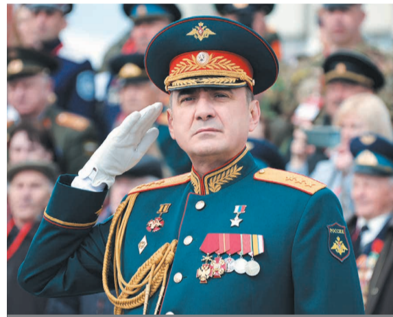
Алексей Дюмин Губернатор Тульской области.

9 мая на площади Ленина в Туле состоялся военный парад. Командовал парадом временно исполняющий обязанности заместителя командира 106-й гвардейской воздушно-десантной Тульской Краснознаменной ордена Кутузова дивизии, гвардии подполковник Евгений Ирьянов.