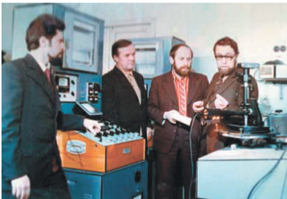
В лаборатории НПО «Тулачермет».

Совместно с украинским НИИ была разработана технология и оборудование установки по непрерывной разливке горизонтального типа. В конце семидесятых годов этот процесс уже внедрялся на ряде заводов