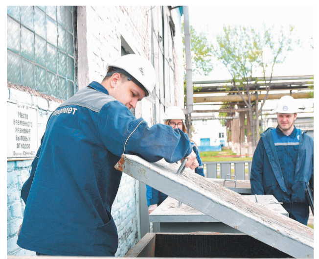
↑ Проверка территории ТЭРЦ.

— Хочу отметить положительную динамику цехов по санитарному состоянию бытовых помещений и мест размещения отходов. Оба цеха очень требовательно и внимательно отнеслись к этой работе. Несмотря на замечания, мы даем положи-