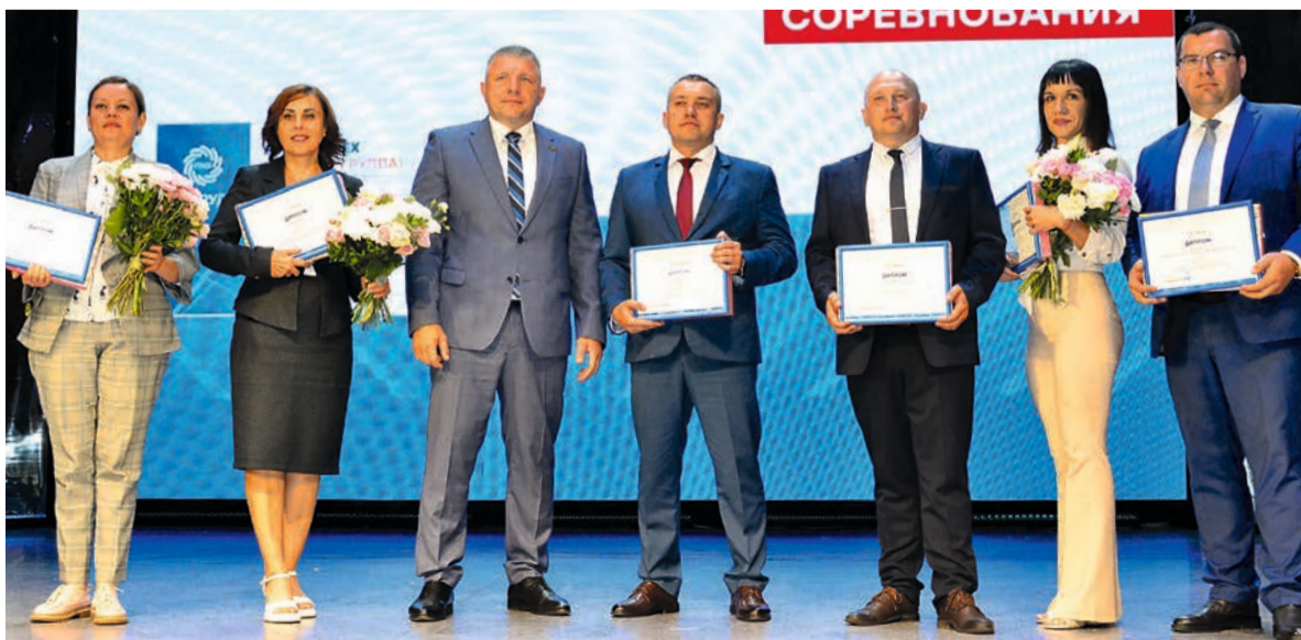
Руководители структурных подразделений – чемпионы трудового соревнования.

Среди коллективов управленческого труда победителями в своих группах признаны: управление закупок, отдел экономической безопасности, служба корпоративной социальной политики.