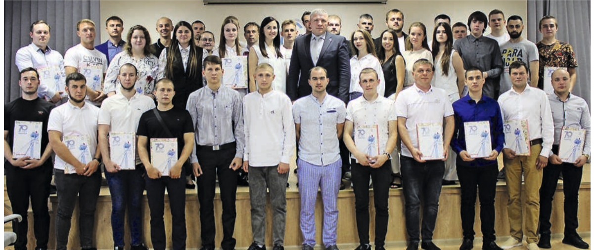
Как минимум на одного дипломированного специалиста стало больше в каждом подразделении комбината.

На комбинате КМАруда поздравили специалистов, окончивших в 2023-2024 годах высшие и средние специальные образовательные учреждения.