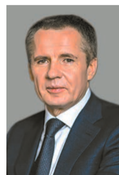
Вячеслав Гладков, губернатор Белгородской области

Желаю всем вам крепкого здоровья, благополучия, неизменных успехов и всего наилучшего!