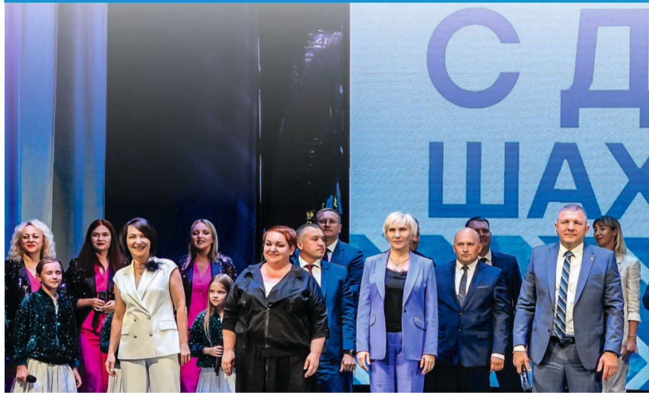
Мощным финалом и неожиданным сюрпризом стал вокальный номер «Мы – единое целое». Его вместе с артистами