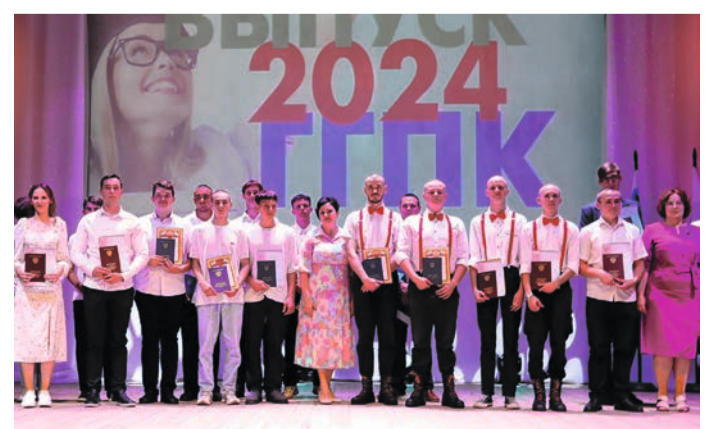
Выпускники Губкинского горно-политехнического колледжа.