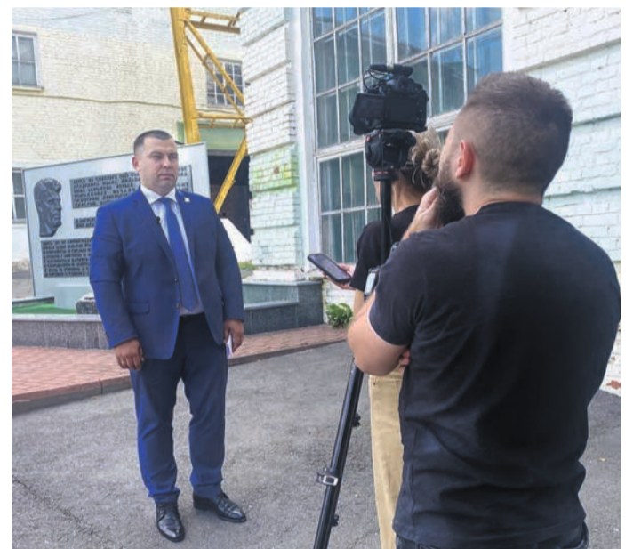
ТВ-группа провела в Губкине одну рабочую смену.