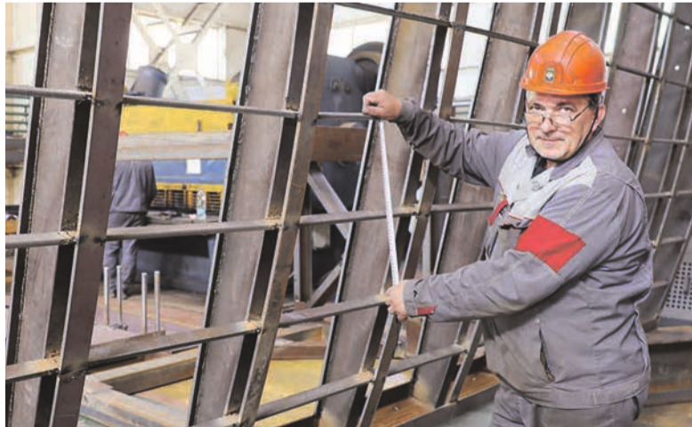
Собран первый подситник для грохота КСМД фабрики.

– Сдаваться – не в моем характере. Вместо проходческого участка шахты, где восстанавливал самоходную технику, временно переведен на дробильно-обогащительную фабрику. Помогаем в капремонте. Есть опыт работы машинистом сырьевых мельниц на заводе строительных материалов, надеюсь, пригодится.