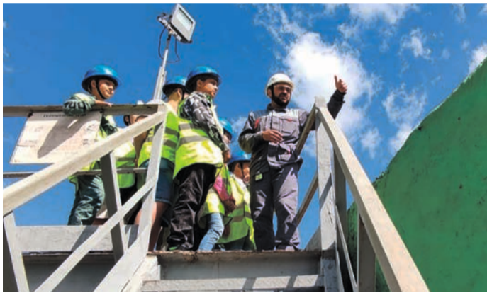
Экскурсия – отличная возможность узнать о работе родителей.

– Рассказал об основах охраны труда, производственной деятельности участка и дробильно-обогащительной фабрики в целом. Дети интересовались переработкой руды, напечатались новыми знаниями и впечатлениями.