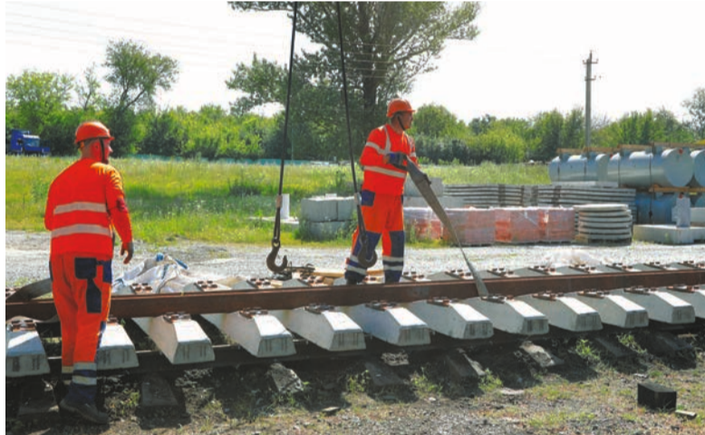
Работники ЖДЦ готовят к замене рельсошпальную решетку.

– От добра – добра не ищут. Работаю на шахте почти год. Устраивают условия проживания, коллектив, зарплата. Сейчас временно выведены на поверхность, помогаем обогатителям на фабрике. Изменился график: вместо сменного теперь 12-часовой. И не очень привычен к жаре, поэтому работаем в тени, соблюдаем питьевой режим.