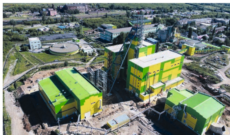
Строительство скипового ствола. 8 августа 2023 года.