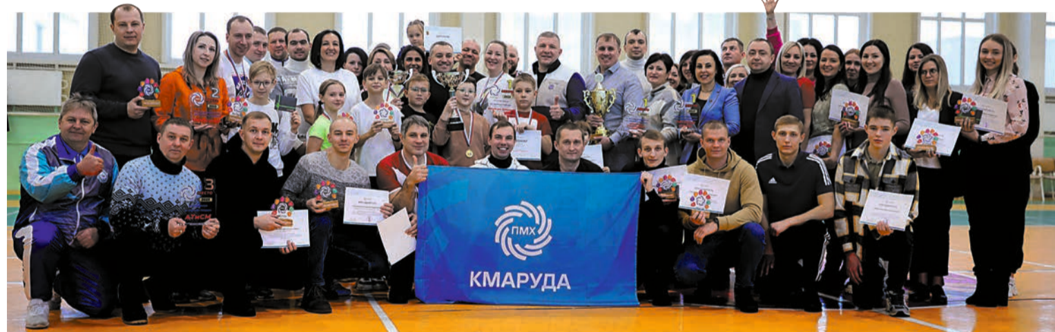
Победители и призеры спартакиады предприятия.