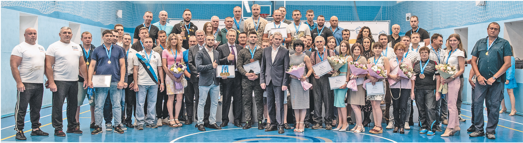
← Спартакиада собрала более 400 спортсменов.